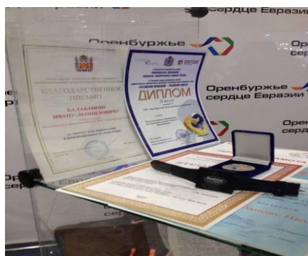
Рисунок 3 - Выставочный образец информационно-аналитического мобильного медицинского устройства «GeoСпас Mobile».

Из этого следует, что продукт будет пользоваться повышенным спросом среди лиц, страдающих хроническими заболеваниями, и будет способствовать снижению уровня смертности.