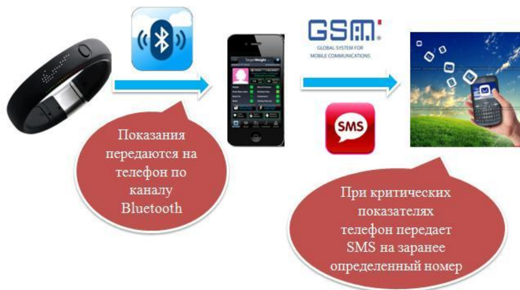
Рисунок 1. Принцип работы информационно-аналитического мобильного медицинского устройства «GeoСпас Mobile».

ние, уровень билирубина и сахара, а также создание информационной базы данных, где будут храниться регистрируемые показатели, а также возможности передачи данных по GSM-сетям в виде СМС-сообщений на заранее заданные номера.