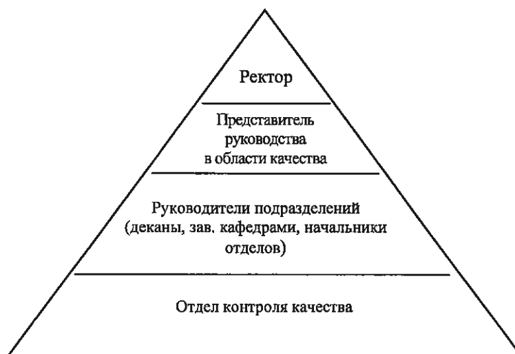
Рисунок Б.1 - Пример организационной структуры СМК Казанского государственного аграрного университета

На рисунке Б.1 представлена интегрированная организационная структура системы менеджмента качества Казанского ГАУ. Ниже перечислены функции, которые выполняются отдельными должностными лицами и подразделениями, входящими в организационную структуру СМК Казанского ГАУ (основные задачи, функции подразделений, должностные обязанности, права и ответственность сотрудников изложены в положениях о структурных подразделениях, инструкциях по выполнению функциональных обязанностей):