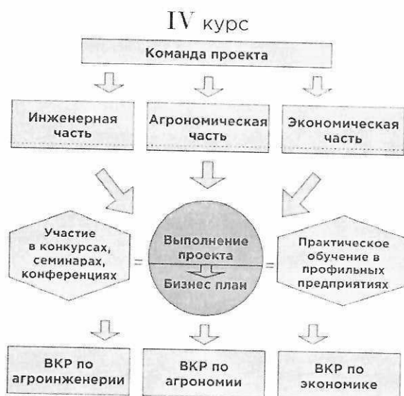
Рисунок 2 - Второй этап