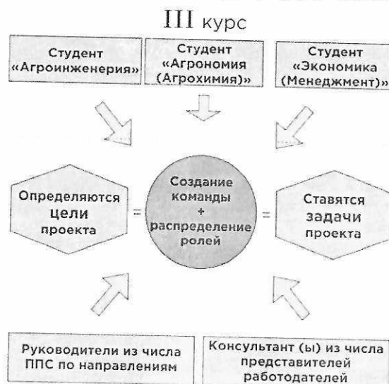
Рисунок 1 – Первый этап