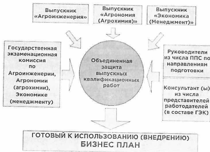
Рисунок 3 - Третий этап